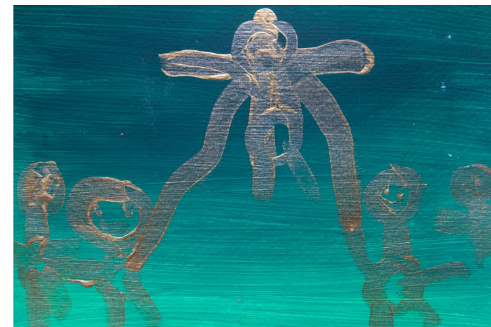
Zeichnung: Maximilian Keim

Dienstag, 5. Juli 2022 09:30-16:30 Uhr Röderhof (Diekholzen)